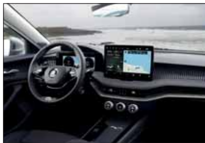
Skoda Superb Combi: Das digitale Bedienkonzept braucht nur wenig Angewöhnung.

Eine erste Fahrt mit dem Neuling zeigte ein digitales Interieur mit grossem zentralem Monitor,