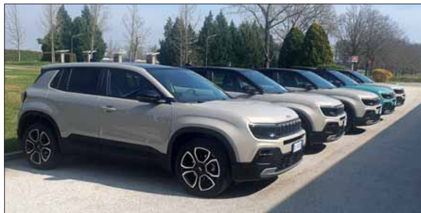
Avenger e-Hybrid: Der teilweise elektrifizierte Jeep passt für viele. RHo

Der 3-Hybrid Avenger fühlt sich sowohl auf der Strasse als auch im Gelände wohl. Entsprechend konnten auf der Strasse die Hybridfunktionen (Energierückgewinnung und Elektroantrieb bei niedriger Geschwindigkeit) und die technischen Funktionen ausprobiert werden. Auf der Off-road-Strecke hingegen bewies er seine erstaunliche Geländegängigkeit. Am Antrieb beteiligt sind ein 1,2-Liter-Turbo-Dreizylinder mit 100 PS, ihm assistiert ein 21-kW-E-Motor der im Doppelkupplungsgetriebe untergebracht ist. Auf einer unterhaltsamen Fahrt über Land und durch urbanes Gebiet zeigte sich der Avenger von seiner besten Seite. Ein sehr günstiger Verbrauch, guter Vortrieb sowie saubere Kurvenfahrt sind seine Stärken. Das Beste dabei ist, dass er ohne Nachladen, wenn nötig mit Benzin um die ganze Welt fährt. RHo