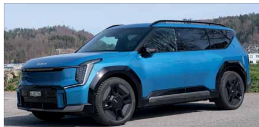
Luxus-Siebenplätzer: Imposant steht der Kia EV9 auf der Strasse. ci