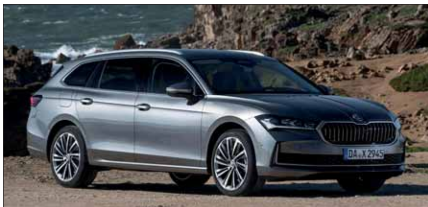
Skoda Superb Combi: Das Flaggsschiff in seiner Grossraumversion.

aber auch praktische Drehschalter. Viel Platz für alle Passagiere ist seit jeher einer der grössten Vorteile des Superb. Der Komfort ist aussergewöhnlich hoch, die Verarbeitung lässt nichts zu wünschen übrig. Ein neu abgestimmtes Fahrwerk sorgt für Präzision und hohen Reisekomfort. Leistung ist in jeder Situation genügend vorhanden, so dass der Superb nicht stark gefordert werden muss. Er ist ein ausserordentlicher Langstrecken-Spezialist, fühlt sich aber auch über Land sehr wohl. Ab nur 54'090 Franken fährt der Neuling zu den Kunden in der Schweiz. RHo