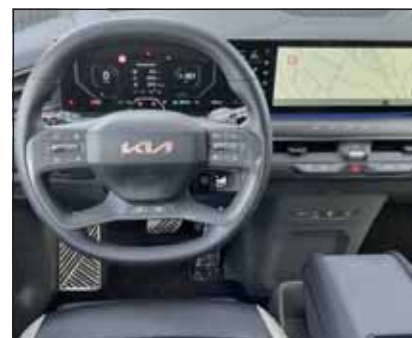
Aufgeräumt: Das EV9-Cockpit ist intuitiv und logisch bedienbar.

2 Motoren, kein Getriebe und 4x4 Die famose 800 Volt Lade-technologie machen den EV9 zum Lademeister. Die grosse 96 kWh-Batterie bunkert Strom für rund 500 km und ist recht rasch voll. Aus dem Stand spurtet der leer 2613 kg wiegende Koloss schneller auf 50 km/h als mancher Sportwagen. Zudem gleitet der EV9 komfortabel über jede Strasse, dem 3,1 m langen Radstand sei Dank. Der EV9 verlangt nach einem geübten Fahrer, der auch bei engen Passagen nicht gleich in Panik gerät. Ein grosses Auto mit sieben Jahren Garantie. RHo