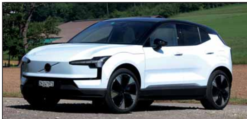
Redaktion: Roland Hofer Der Volvo EX30 ist grossartig.

Kaum ist er da, macht er positiv von sich reden: der Volvo EX30. Er wurde zum World Urban Car 2024 gewählt und hat einen geringen CO2-Fussabdruck. Kunden können aus drei Antriebsvarianten wählen: dem 200 kW starken Single Motor und seine Extended Range Version sowie dem Twin Motor Performance mit 315 kW.