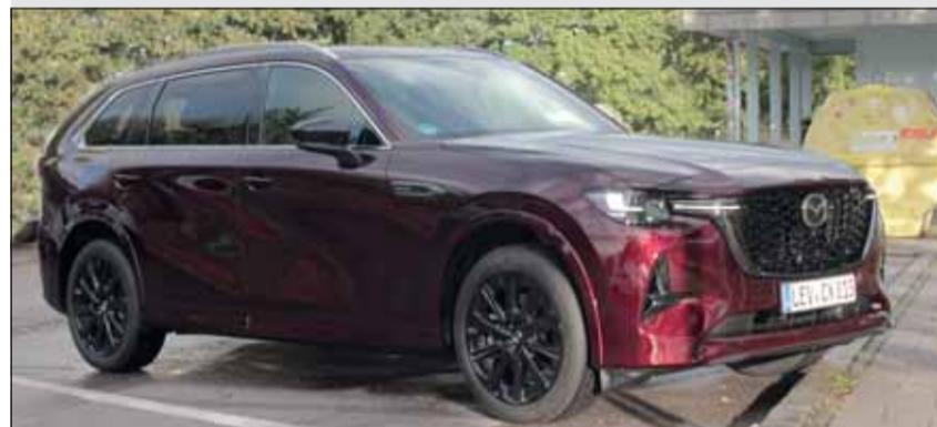
Mazda CX-80: Flaggschiff und Technologieträger zugleich. RHo

Zwei Antriebe sind für den CX-80 im Programm, die beide aus dem CX-60 bekannt sind und jeweils Allradantrieb und Achtgang-Automatik aufweisen. Der Plug-in-Hybrid kombiniert einen 2,5-Liter-Vierzylinder-Benziner mit 141 kW/192 PS und einen Elektromotor mit 129 kW/175 PS zu einer Systemleistung von 241 kW/327 PS. Zweites Aggregat ist der 3,3-Liter-Diesel. Der Sechszylinder, wird von einem 48-Volt-Mildhybridsystem unterstützt und hat eine Leistung von 187 kW/254 PS bei einem Normverbrauch von 5,7 Litern je 100 Kilometer. Die Preise beginnen bei Fr. 67'950.-. Verarbeitung und Komfort sind auf allerhöchstem Niveau. Da staunt sogar die deutsche Premium-Konkurrenz. RHo