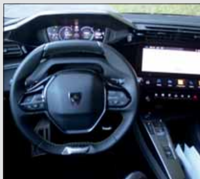
i-Cockpit: Die Anzeigen liegen über dem Lenkrad – typisch Peugeot.

Mit dem deutlich erstarkten Elektromotor – jetzt 115 kW/156 PS und 270 Nm Drehmoment – steht