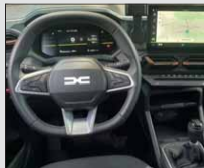
Zeitgemäss: Das Interieur des Dusters ist sauber gefertigt.