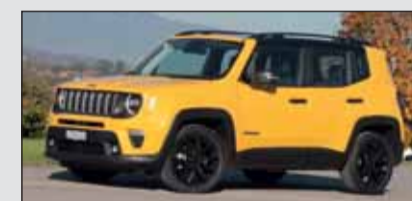
Jeep Renegade: Die 130 PS starke Hybridversion ist gut unterwegs.

Jeep Renegade e-Hybrid Mit dem hybriden Jeep Renegade bietet der legendäre SUV- und Geländewagenanbieter ein der Zeit angepasstes Modell im unteren SUV-Segment. Der wohnlich eingerichtete Innenraum bietet Platz für fünf Personen und ihr Gepäck. Mit dem Facelift haben viele digitale Elemente Einzug gehalten. Modern und Praktisch.