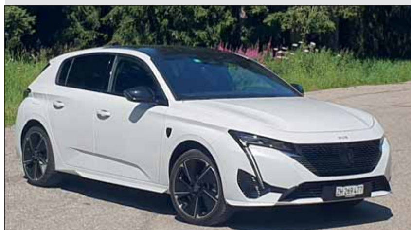
Typisch: Der neue Peugeot elektrische 308 mit klarer Familienzugehörigkeit. RHo

der Fahrspass ganz oben auf der Attraktivitätsliste. Das Mehr an Kraft bewährt sich ebenfalls im Einpedalfahrbetrieb. Dabei wird die Rekuperation auf die höchste Stufe gestellt. So kann der E-308 allein mit dem Gasfuss beschleunigt und verzögert werden. Wer diesen Fahrstil ein wenig übt, spürt rasch, wie entspannt man vorankommt und erst noch unglaublich effektiv und reichweitemschonend. Die Reichweite liegt je nach Umständen zwischen 380 und 430 km. Der für französische Autos typisch hohe Fahrkomfort wird im 308 von einer feinfühligsten Lenkung begleitet. Ein guter Wurf aus Sochaux mit Preisen ab 45'450 Franken. RHo