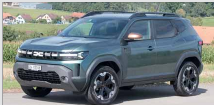
Stellt etwas dar: Der neue Dacia Duster wirkt erwachsener denn je. RHo